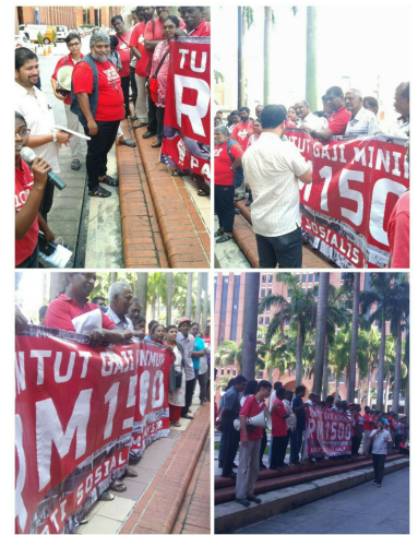
Hong Leong Bank - 20100019070