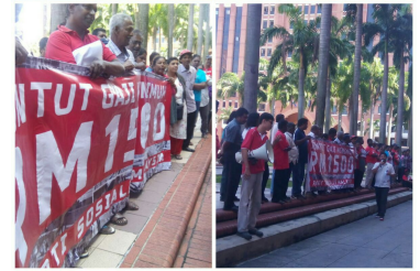
Hong Leong Bank - 20100019070